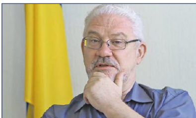
Віктор ШИШКІН перший Ген-прокурор України, екс-суддя Конституційного суду України

«На відміну від так званих демократичних кандидатів, лише націоналіст Кошулинський пропонує ключові принципи усунення олігархів від влади і встановлення реального народовладдя. Це — обрання суддів народом, відкликання депутатів, ветоування громадою рішень місцевої влади тощо. Адже без реального контролю народу над владними інституціями будь яка-деолігархізація залишиться лише пустою порожнім гаслом на білборді».