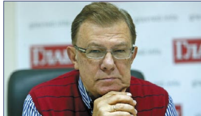
Володимир ЛАНОВИЙ економіст, доктор наук, колишній міністр економіки України

«Що стосується виборності суддів. У нас у Конституції немає такої норми, їх наразі призначає Президент. І буде правильно внести зміни до Конституції, щоби люди самі обирали тих, хто в майбутньому їх судитиме. Тоді це буде дійсно ефективна судова реформа».